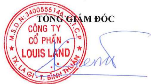
LỮ TRỌNG KIÊN